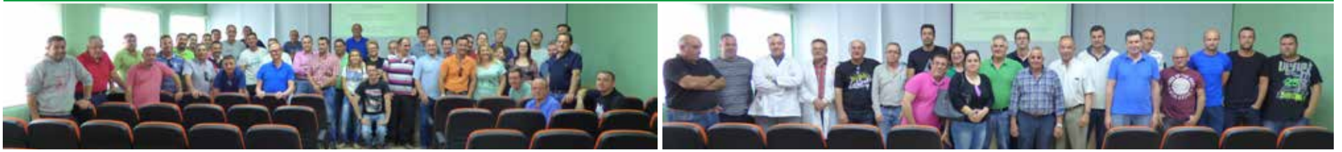
Una parte de los socios de Hortamar.