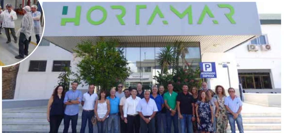
Junta Rectora de Hortamar junto al presidente, personal de oficina y técnicos.

zona hortofrutícola de Roquetas de Mar es una zona de pimiento tardío, estamos planificando sacar la producción al menos dos semanas antes de las fechas habituales. El balance de campaña de la papaya es también positivo. Cada vez estamos cogiendo el mejor manejo de esta fruta tropical y este año hemos sacado más rendimiento respecto al ejercicio anterior, la mayoría de la producción es de primera categoría.”